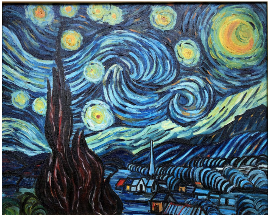
Copia - Notte Stellata di Vincent Van Gogh Stampa su tela da Olio su tela cm 40 x 50 - Anno 1997