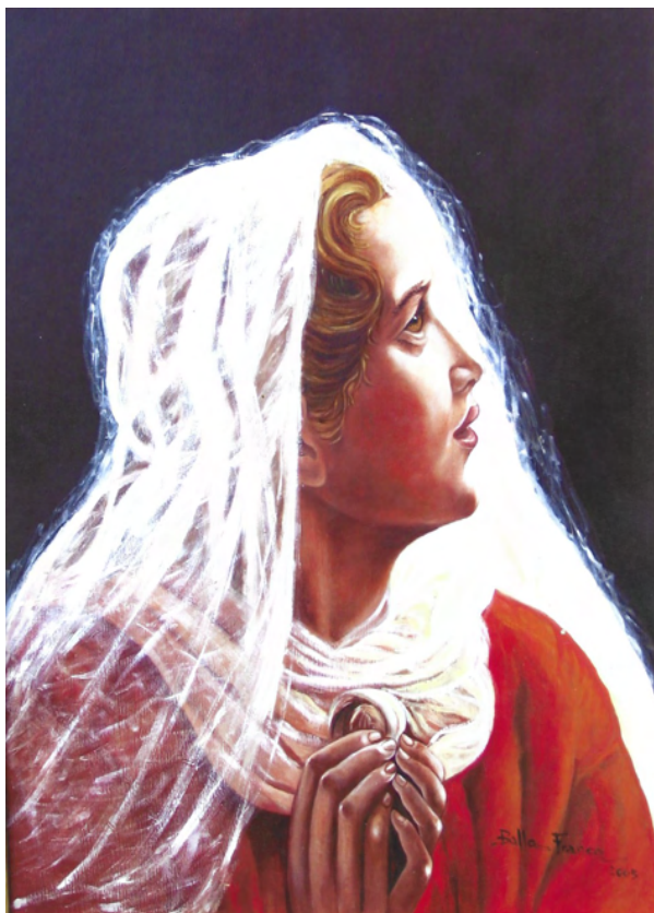
Madonna bambina Stampa su tela da Olio su tela cm 70 x cm 50 - Anno 1995