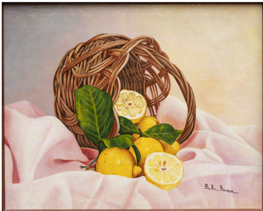
Cesto di limoni Stampa su tela da Olio su tela cm 40 x 50 - Anno 2013