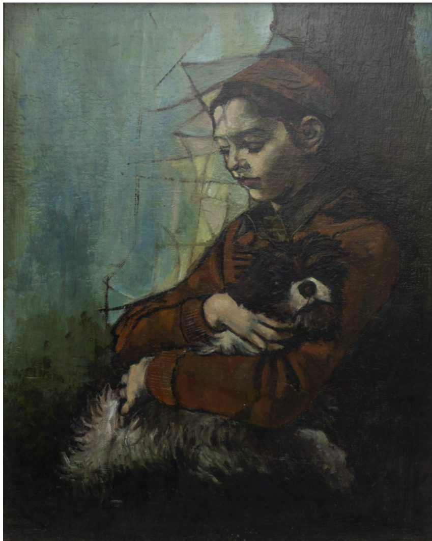
Fanciulla con il cane Stampa su tela da Olio su tela cm 50 x 40 - Anno 1994