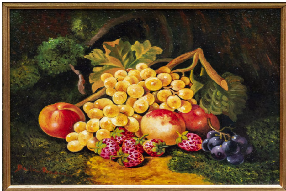
Uva, Pesche e Fragole Stampa su tela da Olio su tela cm 20 x 30 - Anno 1994