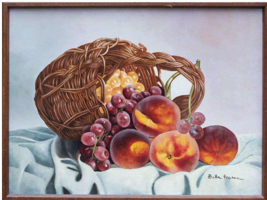
Cesto di pesche Stampa su tela da Olio su tela cm 30 x 40 - Anno 2013