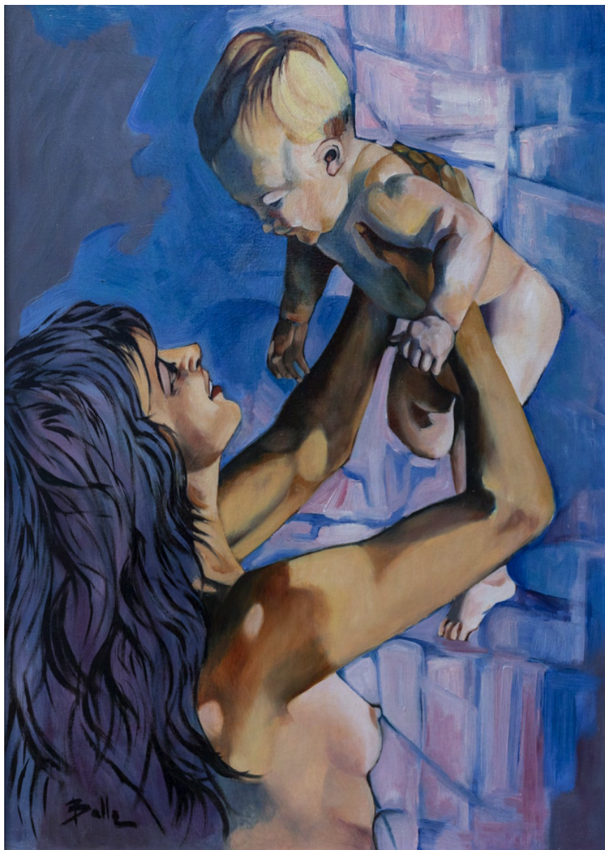
Maternità Blu Stampa su tela da Olio su tela cm 70 x 50 - Anno 1999