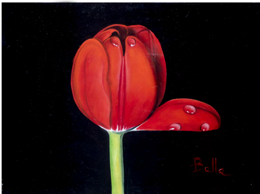
Il Tulipano Rosso Olio su tela Stampa su tela da Olio su tela cm 30 x 40 - Anno 2013